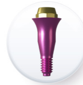
Plate-forme de 4,8 mm

Pilier multi-position droit esthétique M2