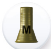
Réf. PITEMUTR DA4075