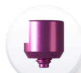
Réf. EPCTEA 4844