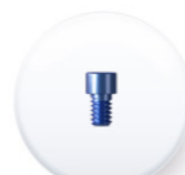
Réf. TMUT 40