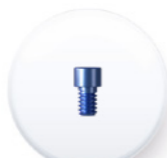
Réf. TMUT 40

Le couple de serrage recommandé pour sa mise en place est de 10 Ncm .