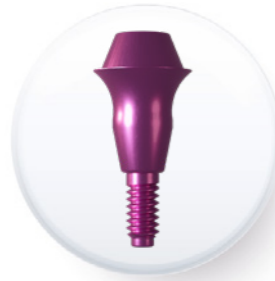
Plate-forme de 4,8 mm

Pilier multi-positions droit esthétique large