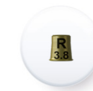
Ref. PITEMUR DA4040