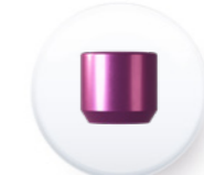
Réf. EPCTR 4844