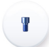
Ref. TMUT 40