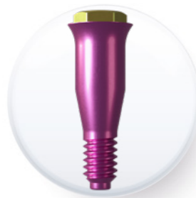
Plate-forme de 3,8 mm

Fabriqué en titane de grade V . Le couple de serrage recommandé pour sa mise en place est de 30 Ncm .