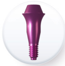
Plate-forme de 4,8 mm

Pilier multi-position droit esthétique M2