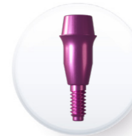
Plate-forme de 3,8 mm

Pilier multi-positions droit esthétique étroit