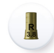
Ref. PITEMUR DA4075