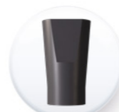
Réf. SBT MUST