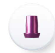
Ref. PCERMUR 40

Les interfaces sont disponibles en sets composés d'une interface et de deux vis TMU 4048 , une vis clinique et une vis de laboratoire.