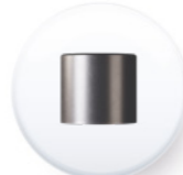
Ref. PCM 4830