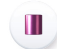
Réf. EPCTR 4044