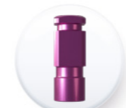
Réf. AIPTTR 40