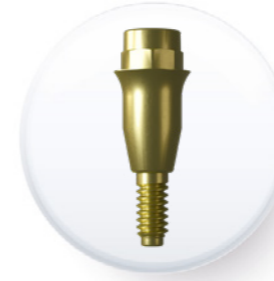
Plate-forme de 3,8 mm

Pilier multi-positions droit esthétique étroit