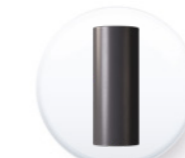
Réf. SBT MUSR