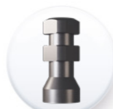
Réf. AIPMU 40