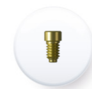
Réf. TPIA DP4048

Le couple de serrage recommandé pour sa mise en place est de 30 Ncm .