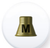
Réf. PITEMUTR DA4040

Les interfaces sont disponibles en sets composés d'une interface et de deux vis TMUT 40, une vis clinique et une vis de laboratoire.