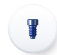
Réf. TMU 4048

Le couple de serrage recommandé pour sa mise en place est de 30 Ncm .